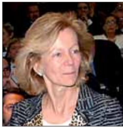
Elena Salgado, ministra de Sanidad y Consumo.