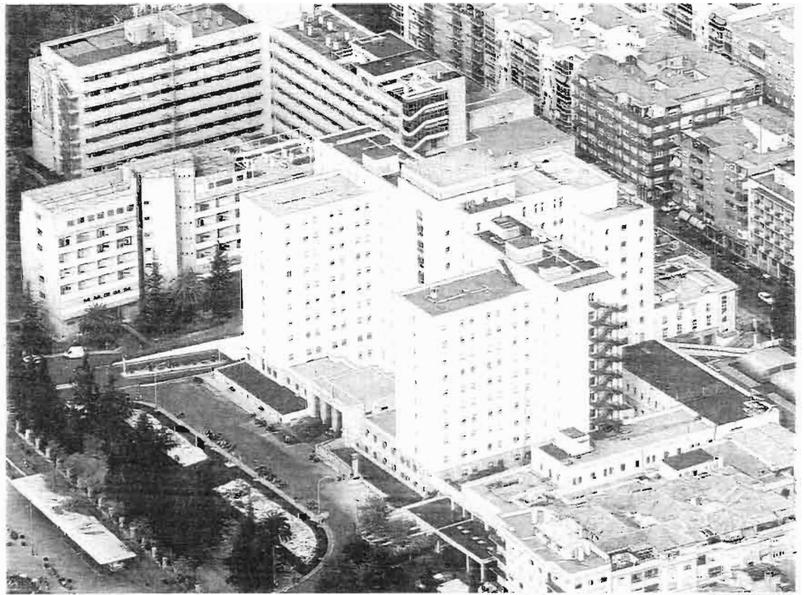
Hospital Virgen de las Nieves, en Granada, de donde partió la denuncia

El fiscal ordena sobseer las diligencias, de todas formas, hasta que la Agencia de Protección de Datos pueda certificar en un informe «una auditoría completa de miles de historias clínicas» que pudiera probar la «falsedad de